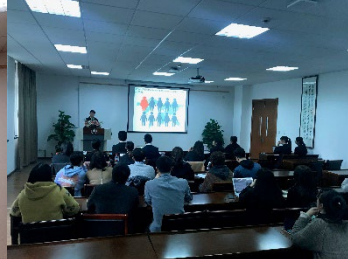
浙江工商大学学生の参加