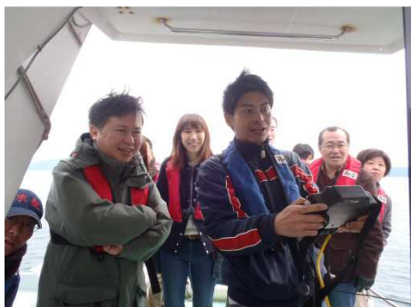
船上では水中カメラを各自で操作しモニターに移し出された藻場を観察いたしました。