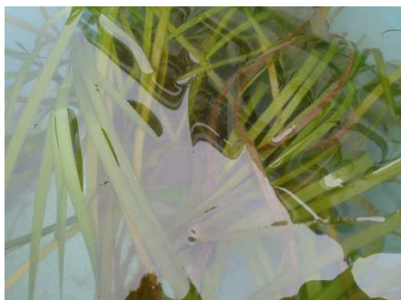
これがアマモです。