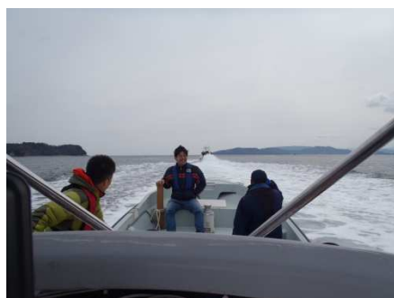
春の日差しの中2隻で藻場に移動いたしました。